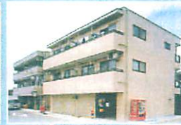
社員寮・社宅のイメージ