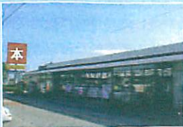
商業・サービス施設のイメージ