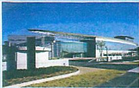
研究・開発・事務施設のイメージ