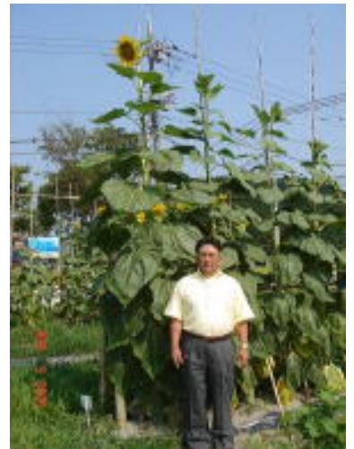
▲背高ひまわりコンテスト・今年自己記録の更新もあって、34名中6位という結果でした。